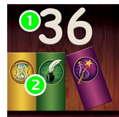
Плитка: 1 – номер, 2 – категории книг