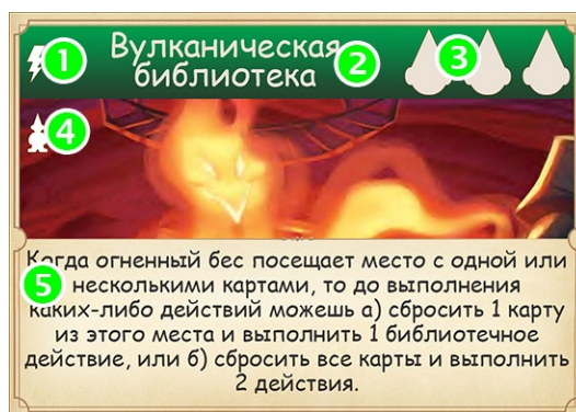
Карта библиотеки: 1 – немедленное действие, 2 – название, 3 – клетки для работников, 4 – метка соло-игры, 5 – действие

Игра состоит из раундов, во время которых игроки делают ходы, отправляя своих работников в разные места, чтобы получить в руку карты. Из этих карт игроки составляют свою библиотеку, размещая плитки в порядке возрастания их номеров, стараясь собрать как можно больше книг требуемой и популярной категорий, и как можно